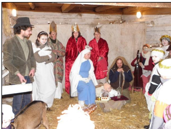
Horecký betlém, 23. 12. 2009