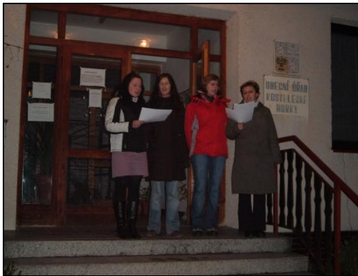
Slavnostní rozsvícení vánočního stroměčku