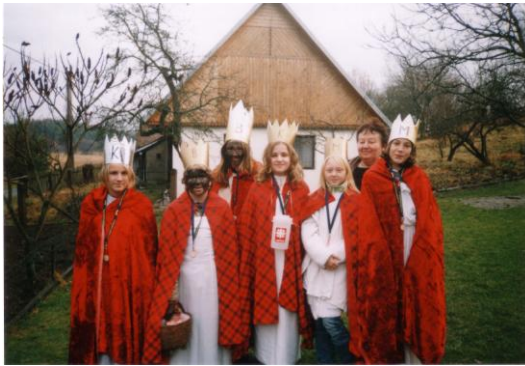
Tři Králové z Horek