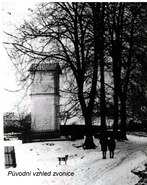
Původní vzhled zvonice

Ve druhé polovině roku byl obci poskytnut mimořádný příspěvek DSO Brodec, z něhož bylo financováno dovybavení obecního hřiště dřevěnými posezeními, odpadkovými nádobami a nádrží na vodu s mycím žlabem. Po předložské výměně antuky je to tedy další vylepšení našeho sportoviště.